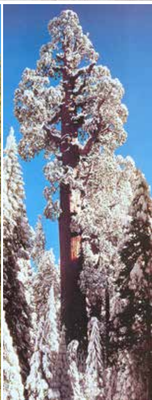
General Grant - Amerikarnarnas officiella julträd.