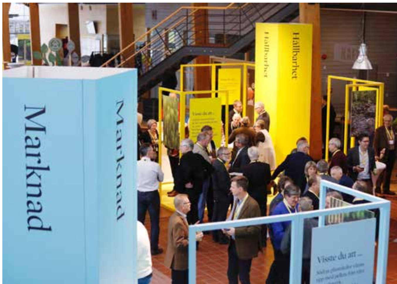
Medlemsaktiviteter som framtidsdagen innebär möjligheter att utbyta erfarenheter samt att skapa kontakter och nätverk mellan medlemmar.

förbundsstämma. Dessutom föreslår valberedningen ekonomisk ersättning till styrelse, förvaltningsråd, fullmäktige, förtroendevalda och revisorer. Valberedningen ska bestå av fem-sju ledamöter och dess sammansättning ska spegla medlemskåren och om möjligt hela medlemsområdet.