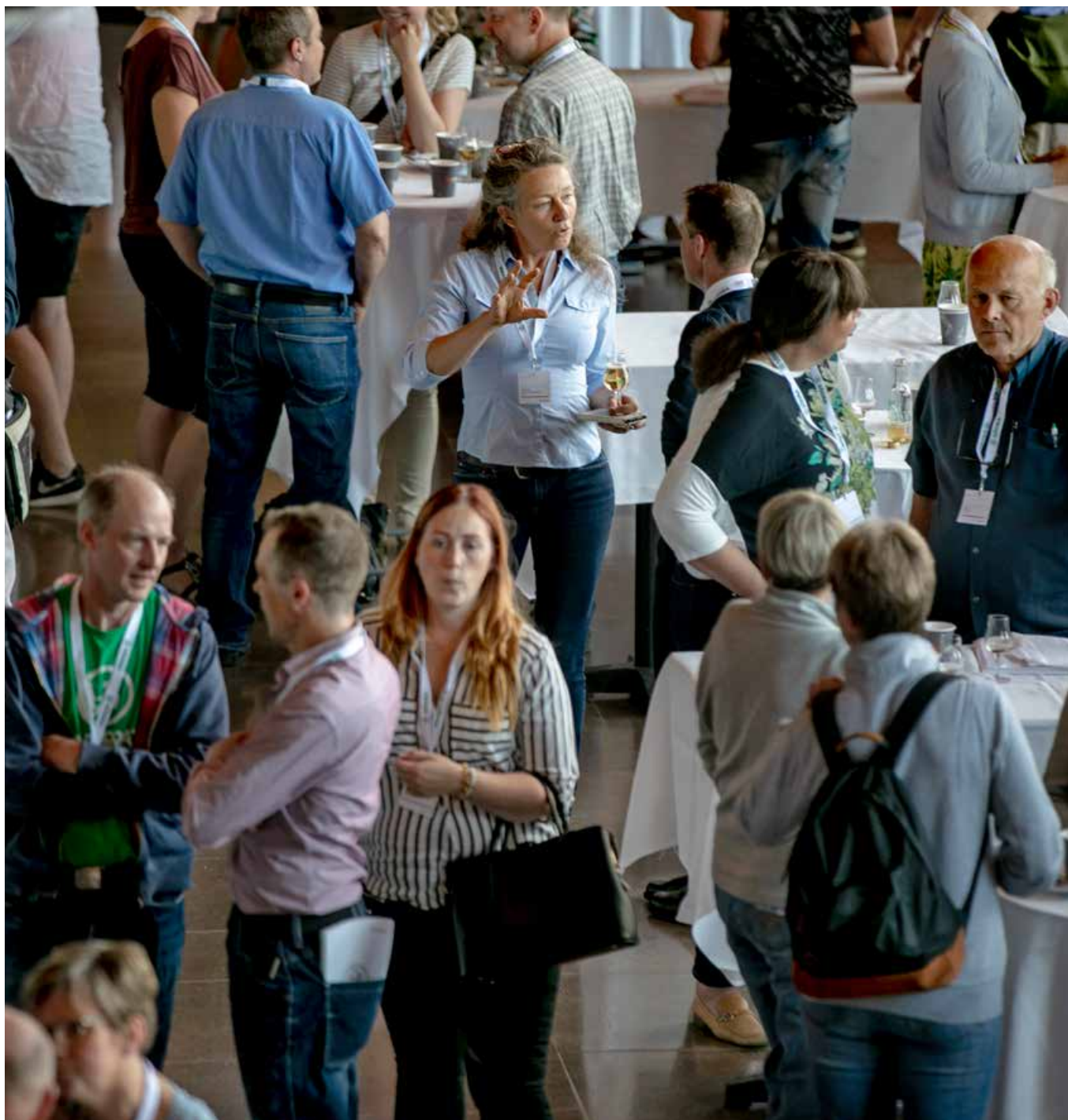
Vid föreningsstämman behandlas inkomna motioner och beslut fattas om vinstdisposition. De 200 fullmäktige är valda på på skogsbruksområdenas årsmöten.

tidig höst diskutera frågan i förtroenderåden och inkomma med förslag på såväl medlemmar som externa kandidater.